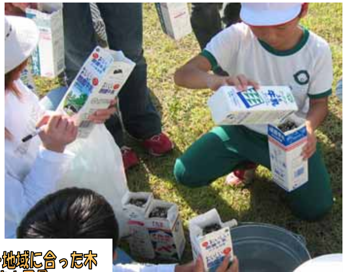
地元産の苗づくり……地域に合った木 どんぐりの種まき風景