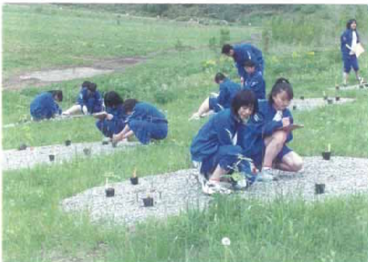
写真 2-16 タネから育てた苗を植栽する中学生

参加者は、用意された30～40種の実生群ポット苗ないし重量級のタネから10種を選んでトレーに入れ、担当しているユニットに運ぶ(写真2-15)。この過程で、参加者は自然林を構成する樹種の多さを認識する。なお、参加者が任意で選ぶため、最後の方は同じ樹種が残ることもあるが、1ユニット内で最終的に残るのは1ないし2種であり、問題は無い。