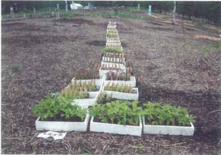
写真 2-14 植栽地に並べられた実生群ポット苗

樹種・採種地・播種年月日を記入した木製ラベルを挿した実生群ポット苗と、同様の木製ラベルを添えた重量級のタネ30～40種が樹種ごとに準備されている(写真2-14)。