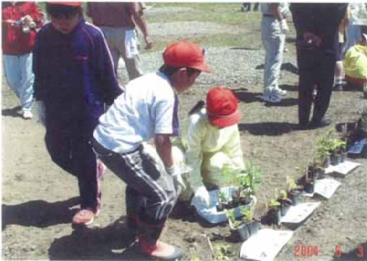
写真 2-15 参加者による実生群ポットの選択

樹種・採種地・播種年月日を記入した木製ラベルを挿した実生群ポット苗と、同様の木製ラベルを添えた重量級のタネ30～40種が樹種ごとに準備されている(写真2-14)。