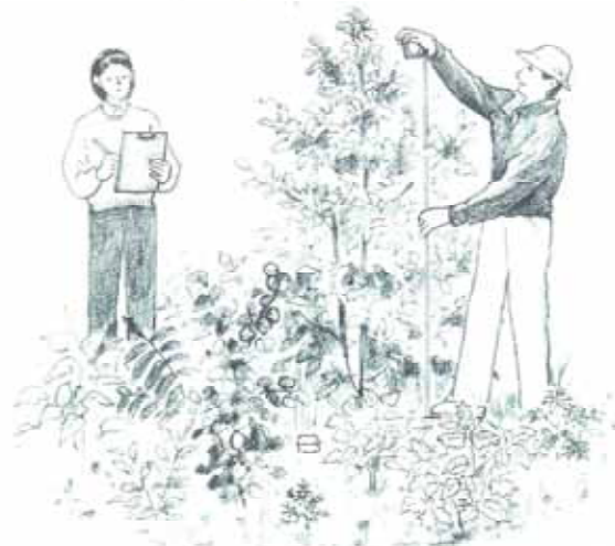
図1-6 生態学的混播・混植法作業の流れ